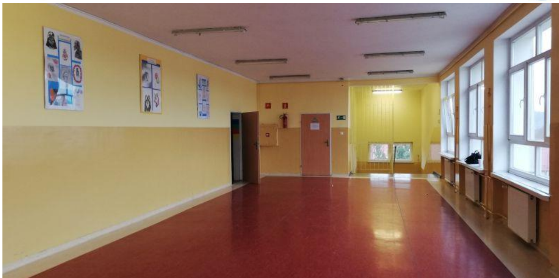
Fot.3. Szkoła Podstawowa nr 2 im. Marii Konopnickiej w Jastrowiu