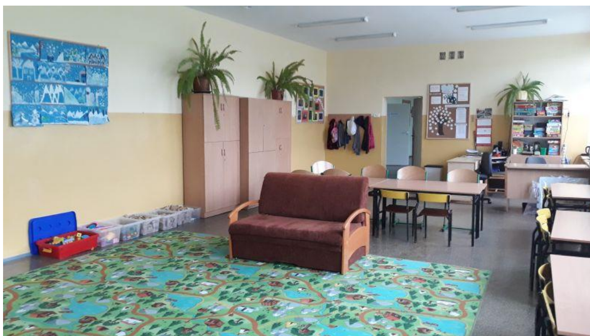
Fot.2. Publiczna Szkoła Podstawowa im. Marii Konopnickiej w Krajence, ul. St. Polańskiego 3 (budynek przy ulicy Bydgoskiej 3)