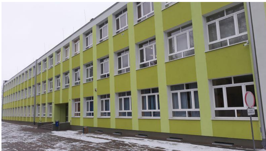
Fot.4. Publiczna Szkoła Podstawowa im. Marii Konopnickiej w Krajence, ul. St. Polańskiego 3 (budynek przy ul. Bydgoskiej 3)

- rozbudowy - sale dydaktyczne - w 2 szkołach z 1 sali większej powstały 2 sale (postawienie ściany i przedsionka, szpachlowanie i malowanie ścian, zmieniono instalację elektryczną, zamontowano progi i listwy przypodłogowe, wstawiono nowe drzwi, wymieniono wykładzinę podłogową, położono płyty OSB na podłodze, pomalowano ściany i sufit (dotyczy 1 szkoły podstawowej i 1 zespołu szkół).